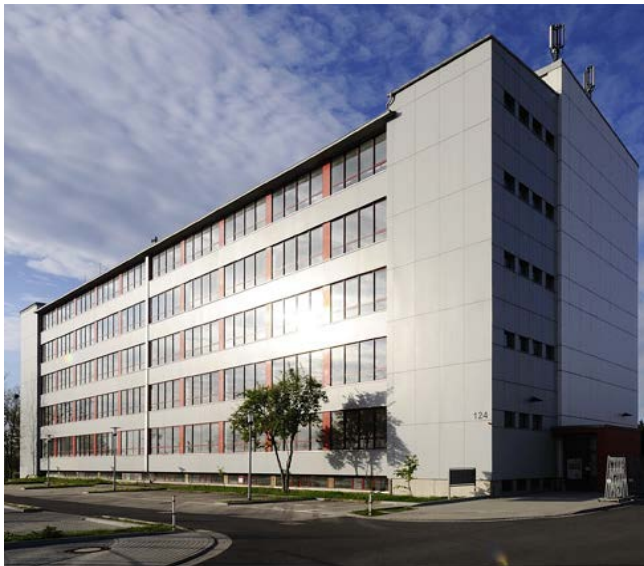
5-geschossiges Büro- und Gewerbeobjekt Holzhäuser Str. 124