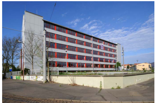
Holzhäuser Straße 124