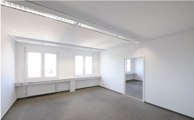
Innenansicht Holzhäuser Straße 120