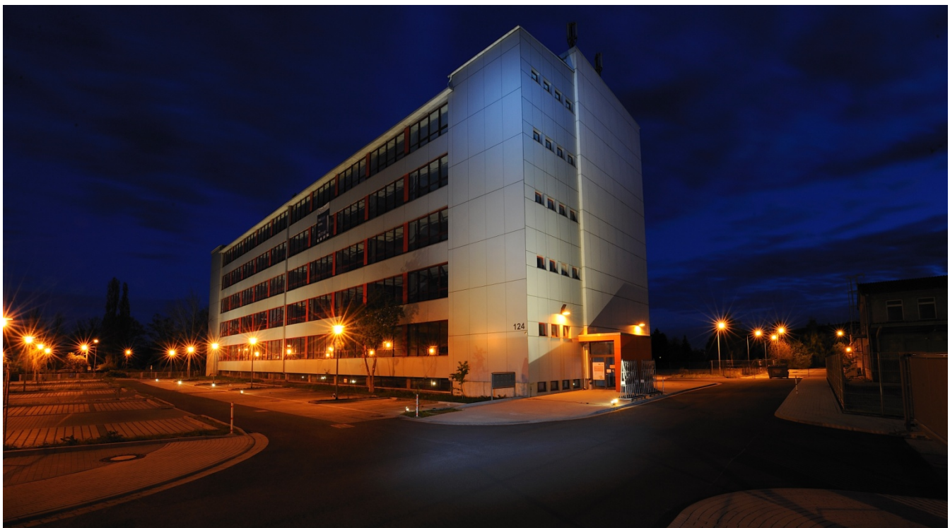
Das weitläufige Areal des Stötteritzpark mit ausreichend Parkplätzen und weiteren Freiflächen.

Gern vereinbaren wir mit Ihnen einen unverbindlichen Besichtigungstermin und erstellen auf dieser Basis ein attraktives Mietangebot.