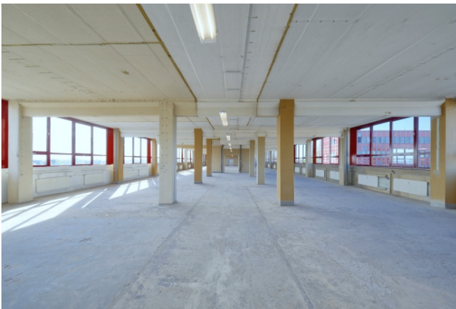
Innenansicht Holzhäuser Straße 124