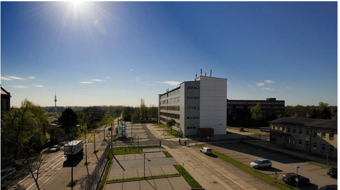
Das weitläufige Areal des Stötteritzpark mit ausreichend Parkplätzen und weiteren Freiflächen.

Für Unternehmen, die höchste Wirtschaftlichkeit und Zweckmäßigkeit in einer verkehrsgünstigen und lebenswerten Umgebung suchen, ist der Stötteritzpark der ideale Standort. Hier finden Sie Ihre Gewerbefläche zu einem Preis, der auch Ihren Controller überzeugen wird.