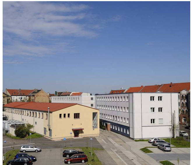
4-geschossiger Doppelbau Holzhäuser Str. 120