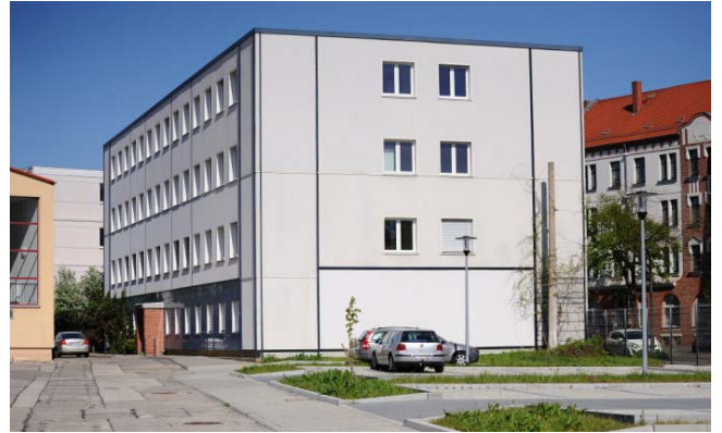
Holzhäuser Straße 120